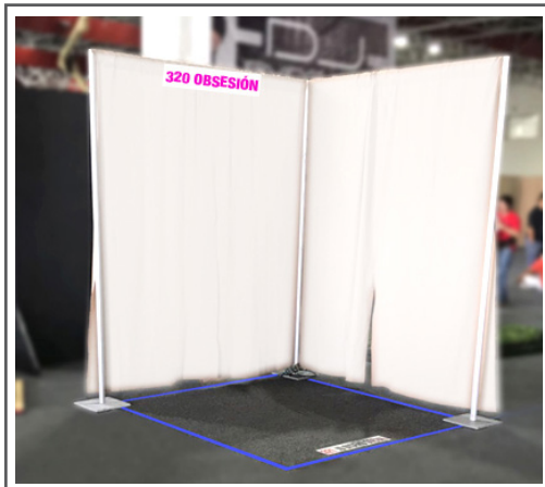
Tipo A: 2 x 2